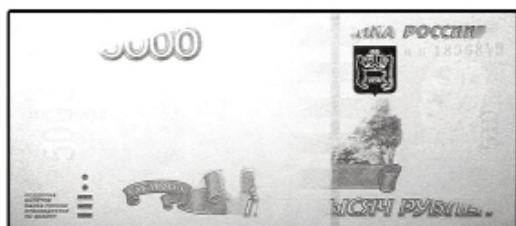
5000 рублей обр. 1997 г.