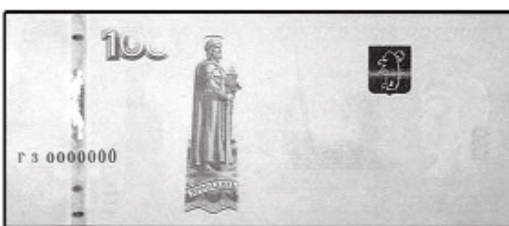
1000 рублей мод. 2010 г.