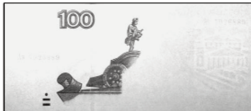
100 рублей мод. 2004 г.