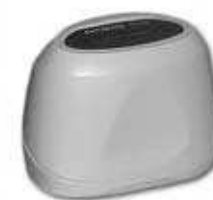
Телевизионная лупа DORS 1010

Подключить лупу DORS 1010 или DORS 1020 к гнезду V1 или V2 на задней панели прибора. Тип лупы опознается автоматически при включении прибора, поэтому присоединять кабель лупы нужно либо к выключенному из сети прибору, либо к прибору, находящемуся в дежурном режиме. Включить прибор. Нажать на кнопку Select на верхней части лупы. Прибор переключится в режим просмотра картинки с лупы. Последующие нажатия на кнопку Select на лупе позволят выбрать необходимый источник подсветки. Лупа DORS 1010 имеет два источника подсветки - белый и