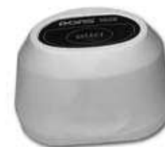
Телевизионная лупа DORS 1020

ИК, а лупа DORS 1020 - три: белый, ИК и УФ. На состояние подсветки указывает цвет индикатора видеовхода, к которому подключена лупа. Белой подсветке соответствует одновременное свечение синего, зеленого и красного индикаторов. ИК-подсветке - свечение красного индикатора. УФ-подсветке - свечение синего индикатора. Переключить прибор на просмотр при помощи внутренней ИК-камеры можно при помощи кнопки Input select .