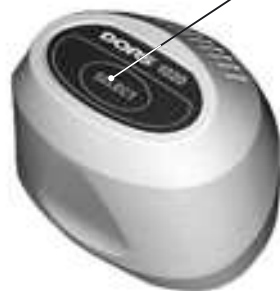
Fig. 5. DORS 1020 television magnifier

nifier has three types of illumination: white, IR and UV. For the on-screen menu of the monitor indicates the status of the illumination. Note Zoom White corresponds to the white illumination, note Zoom IR - to the infrared illumination, note Zoom UV - to the ultraviolet illumination. It is possible to change over the device to observation with the help of the internal IR camera by means of the INPUT button.