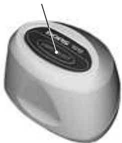
Fig. 4. DORS 1010 television magnifier

picture is color (if the color object is available).